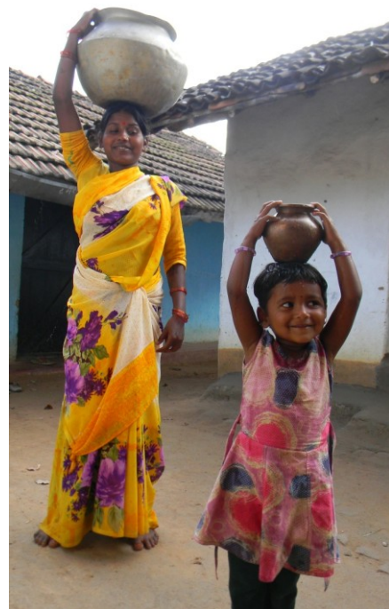
जैसी माँ, वैसी बेटी: नकल करते करते सीख जाना

समतावादी होने के नाते आदिवासी समाज में सत्ता के ढांचे न्यूनतम हैं. गाँव के मुखिया की वेशभूषा गाँव के अन्य लोगों जैसी ही होती है. महिलायों और पुरुषों के सामान अधिकार होते हैं. समाज में उनके मत का सम्मान होता है - विशेषकर शादी और तलाक के मामले में. जहाँ पुरानी पीढ़ी के लोग अभी भी परंपरागत पोशाक पहनते हैं, वहीं नई पीढ़ी ने देश के लोकप्रिय कपड़े जैसे सलवार-कमीज़ और पैंट-शर्ट आदि पहनना शुरू कर दिया है.